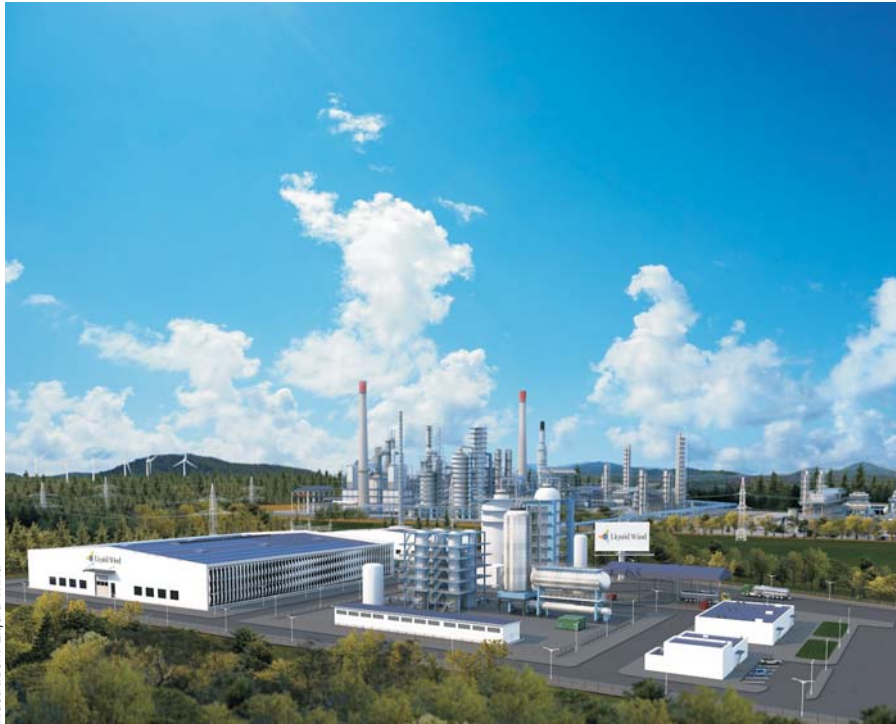
Illustration: Liquid Wind

Den svenske virksomhed Liquid Wind har sikret sig én milliard svenske kroner til et anlæg, der skal producere 45.000 tons grøn metanol om året. Målet er at få opført seks metanolanlæg inden 2030.