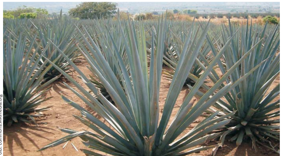
Agave er en meget hårdfør plante, der kræver 69 procent mindre vand sukkerrør.

Ifølge IEA stod Kina i 2019 for over halvdelen af verdens biomassebaserede elproduktion (4,7 GW), og var den tredjestørste globale producent af bioethanol. I 2018 var 186.000 kinesiske arbejdspladser knyttet til varme- og elproduktion fra biomasse og cirka 145.000 kinesere arbejdede inden for biogasbranchen.