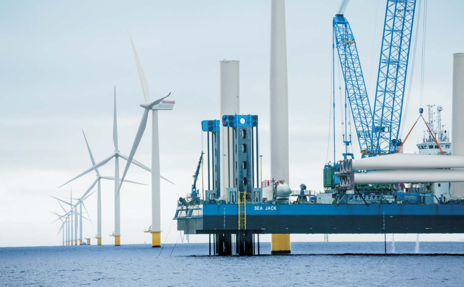
Energiselskabet Ørsted er et blandt mange selskaber, der satser på at producere brint i stor skala. Billedet er fra selskabets havindmøllepark ved Anholt.

af CO 2 -udslippet i Nordsøen, så klimaaftrykket reduceres.