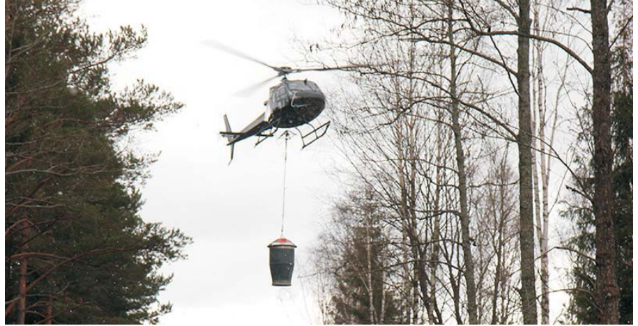
Askegranulat kan spredes med en helikopter eller ved hjælp af forskellige typer "jordspredere".

– Hvis du ikke fører asken tilbage til skovbunden, vil det på sigt gå ud over produktionen af vedmasse og