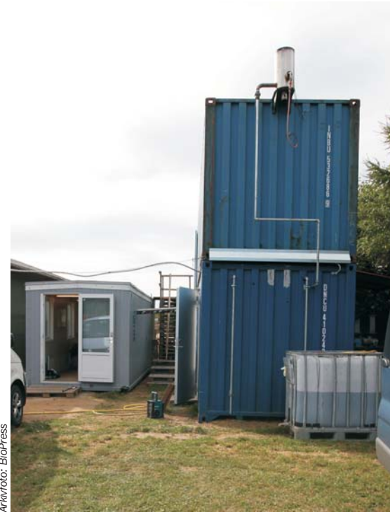
Organic Fuel Technologys demonstrationsanlæg i Ødum nord for Aarhus.