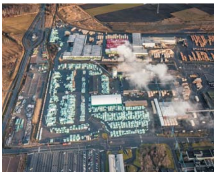
Södras sawværk i Värö