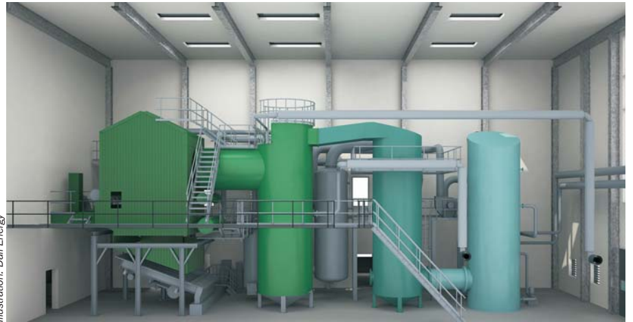
Illustration: Dall Energy

– Vi har blandt andet ændret styringen, så temperaturen i kedlen nu kan styres på to måder, og på røg-