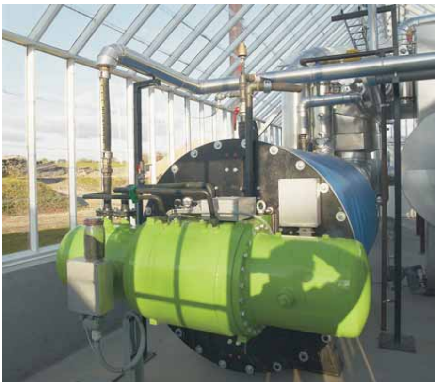
Aarstiderne, der leverer økologisk frugt og grønsager, har siden 2008 haft et pyrolyseanlæg, der producerer biochar til opbygning af jordens kulstofpulje.

Når biochar udbringes på landbrugsjorden vil kulstoffet blive lagret i