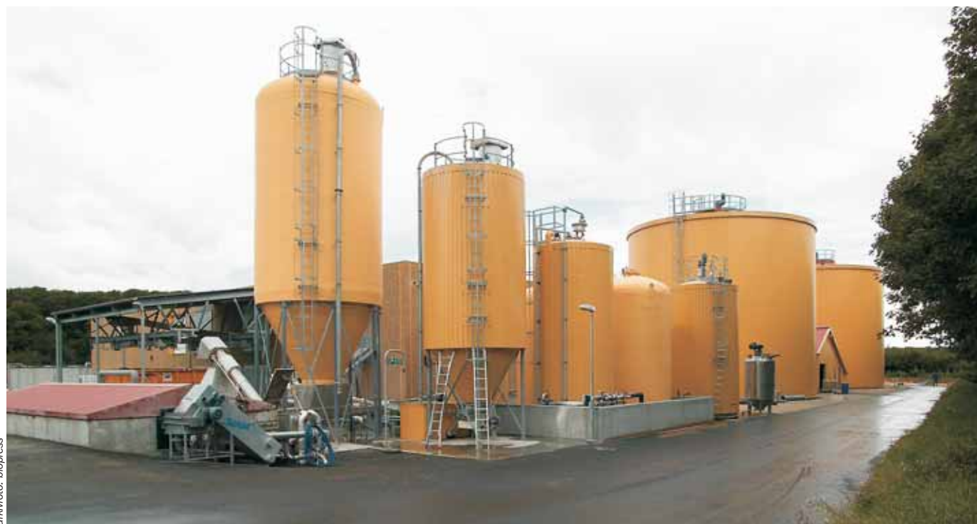
Forsøg på Overgård Gods har vist, at produktionen af biogas kan øges med 20 – 25 procent. Forsøgene, der bliver afsluttet i løbet af efteråret, er støttet af Fødevaredirektoratet.

– Vores forsøg har vist, at vi kan afgasse halm på 6 – 7 dage, fortæller