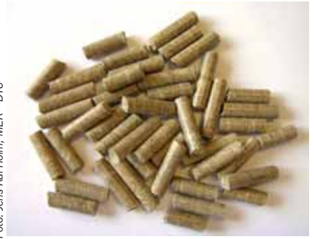
Sådan skal de færdige træpiller gerne se ud.

et passende fugtindhold i biomassen kan være en fordel.