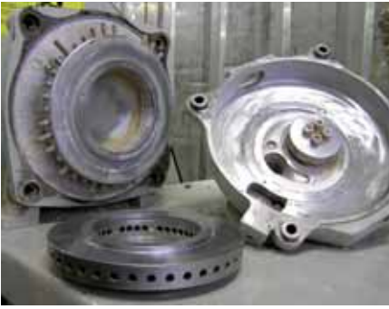
Roterende pillepresse adskilt for inspektion.

usædvanligt, at man bruger træstammer direkte fra skoven, som først skal hugges til flis, sønderdeles i en hammermølle og tørres, før det kan presses til piller.