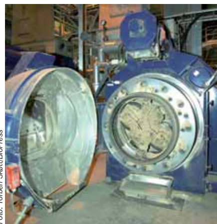
Roterende pillepresse på Køge Biopillefabrik. En stor del af forsøgene på Institut for Mekanik, Energi og Konstruktion er foretaget på en tilsvarende presse – blot i mindre målestok.

Forholdene omkring de kemiske mekanismer er ikke helt afklaret, men det går blandt andet ud på, at lignin – som er en af hovedbestanddelene i biomasse – ændrer karakter som funktion af tryk, temperatur og vandindhold. På den måde kan det være med til at binde pulveret sammen, ligesom