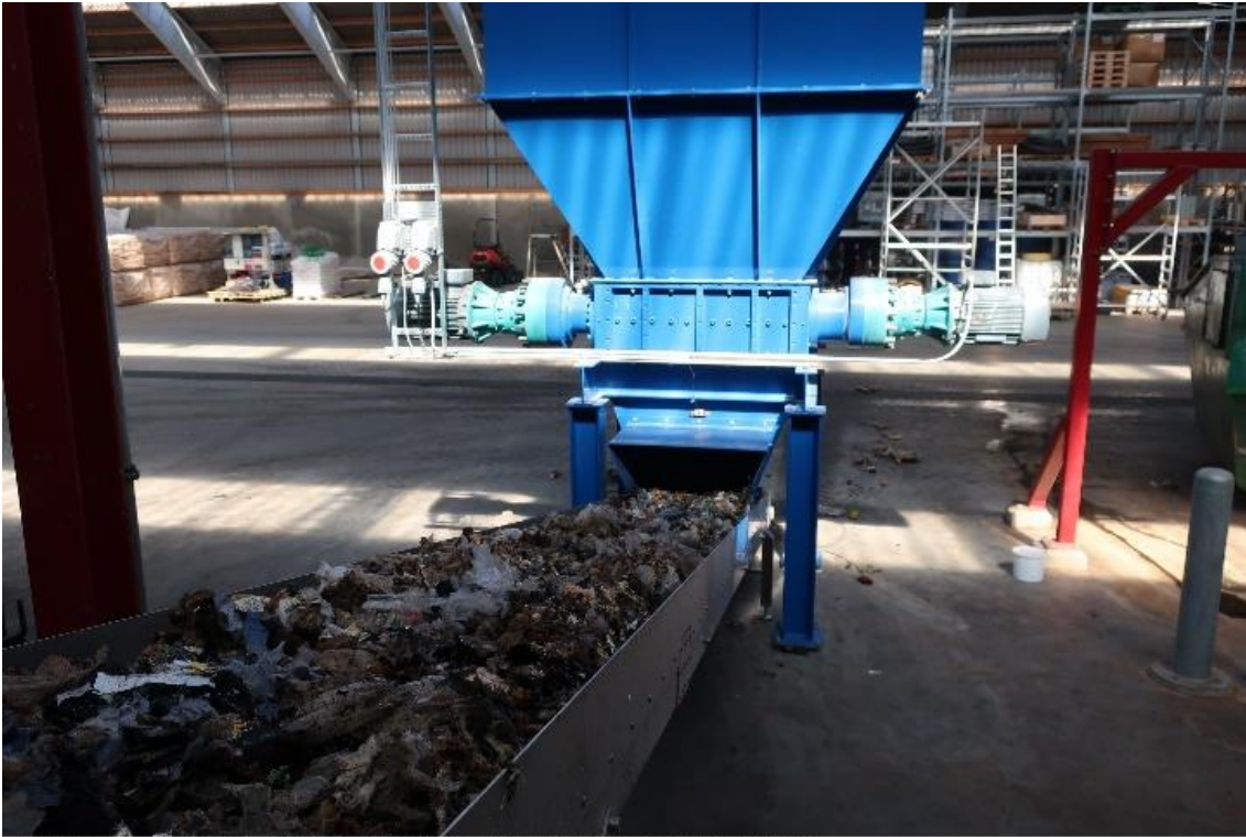
De Waster 2korrs separation - affald efter neddel og for separationsaffald, 19.04.2010, kl. 12:11

CVR nr.:28450850, www.lemvigbiogas.com, E-post: lemvigbiogas@lemvigbiogas.dk