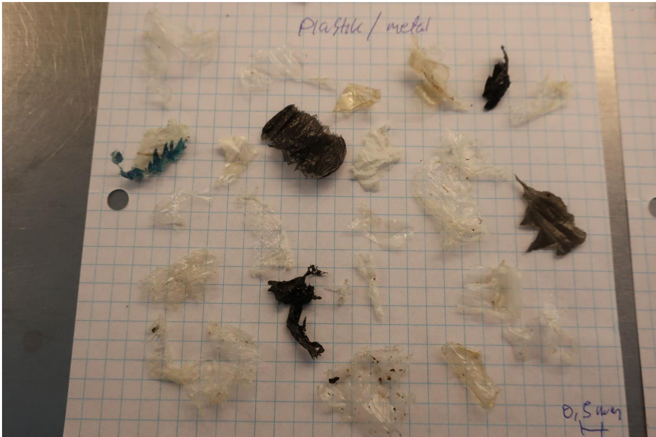
LB analyse af pulp fra Dewaster prøve 19-04-2018 nr 2 - andel af plast og metal over 8 mm, 04.05.2018, kl. 11:34

CVR nr.:28450850, www.lemvigbiogas.com, E-post: lemvigbiogas@lemvigbiogas.dk