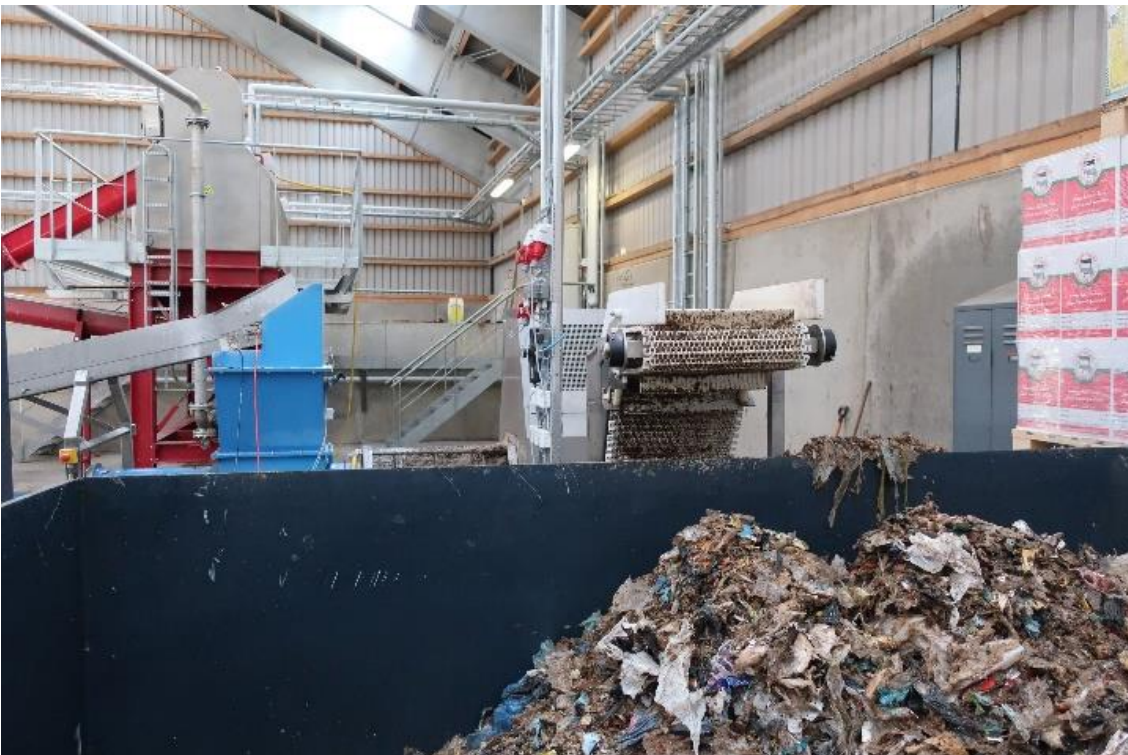
De Waster afleids separation - pulpende an efter separationen af affaldet (14), 19.04.2014, kl. 12:16

Lemvig Biogasanlæg modtager leverancer døgnet rundt, alle ugens 7 dage, året rundt. Behandlingskapaciteten er 800 ton biomasse/døgn.