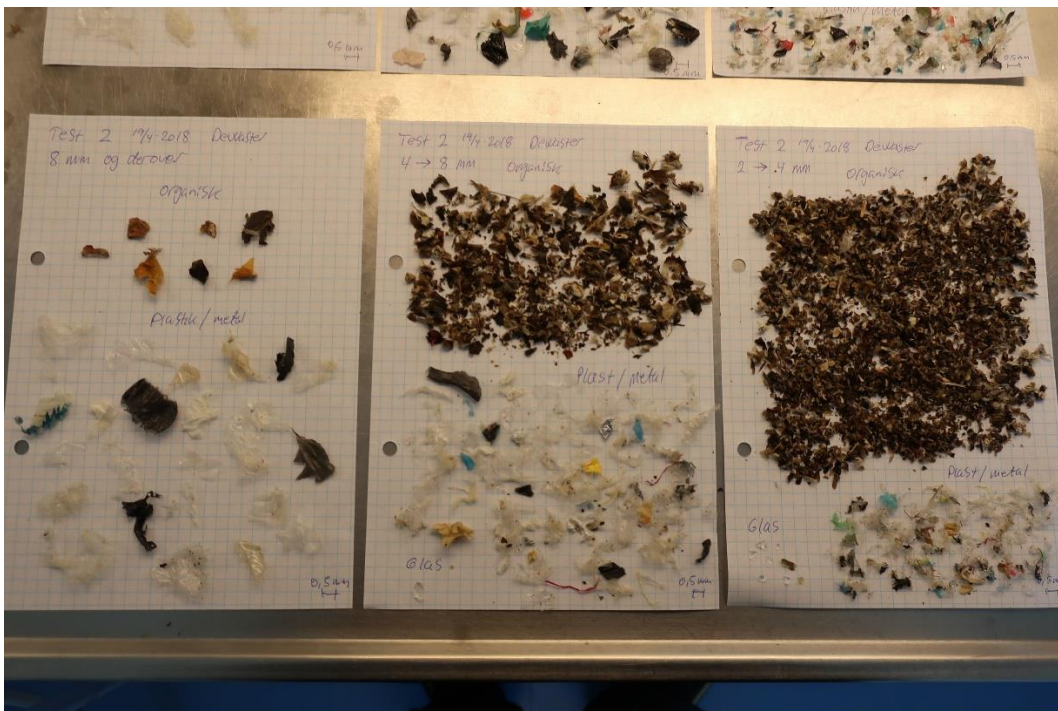
LB analyse af pulp fra DeWaster prøve 19-04-2018 nr 2, 04.05.2018, kl. 11:33

Lemvig Biogasanlæg modtager leverancer døgnet rundt, alle ugens 7 dage, året rundt. Behandlingskapaciteten er 800 ton biomasse/døgn.