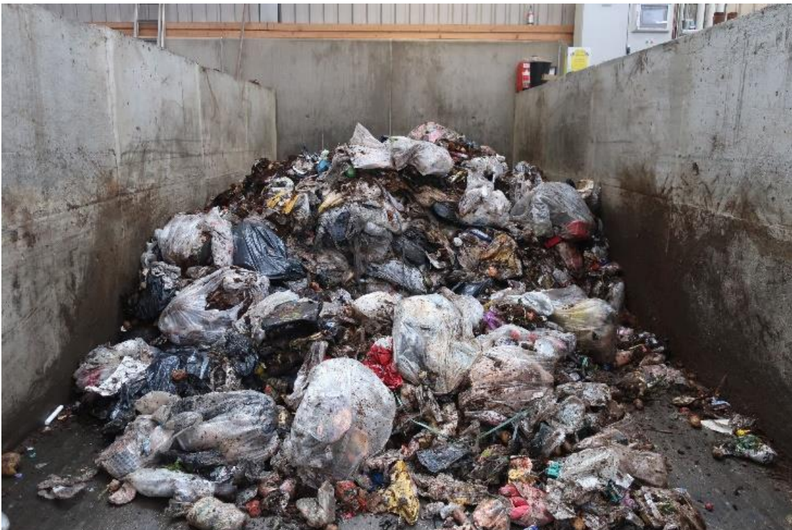
De Waster 2korrs separation - affald, 19.04.2010, kl. 12:32

Lemvig Biogasanlæg modtager leverancer døgnet rundt, alle ugens 7 dage, året rundt. Behandlingskapaciteten er 800 ton biomasse/døgn.