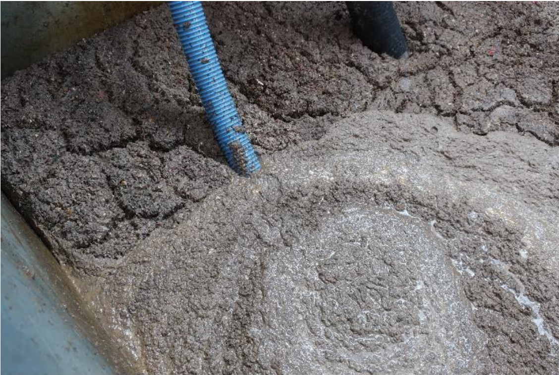
De Waster afleids separation - pulpende an efter separationen af affaldet (1), 19.04.2014, kl. 12:54

CVR nr.:28450850, www.lemvigbiogas.com, E-post: lemvigbiogas@lemvigbiogas.dk